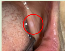
歯茎に潰瘍ができて痛くて使えない