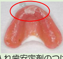
入れ歯安定剤のつけすぎ。かえて安定が悪く、汚れが溜る