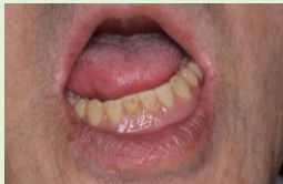
口を開けただけで外れてしまう入れ歯